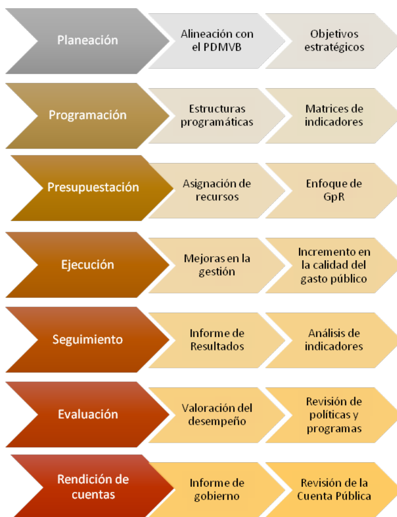
Esquema 1. Proceso Presupuestario basado en Resultados