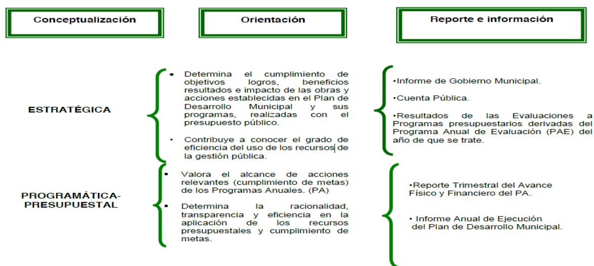
Esquema 3. Evaluación municipal